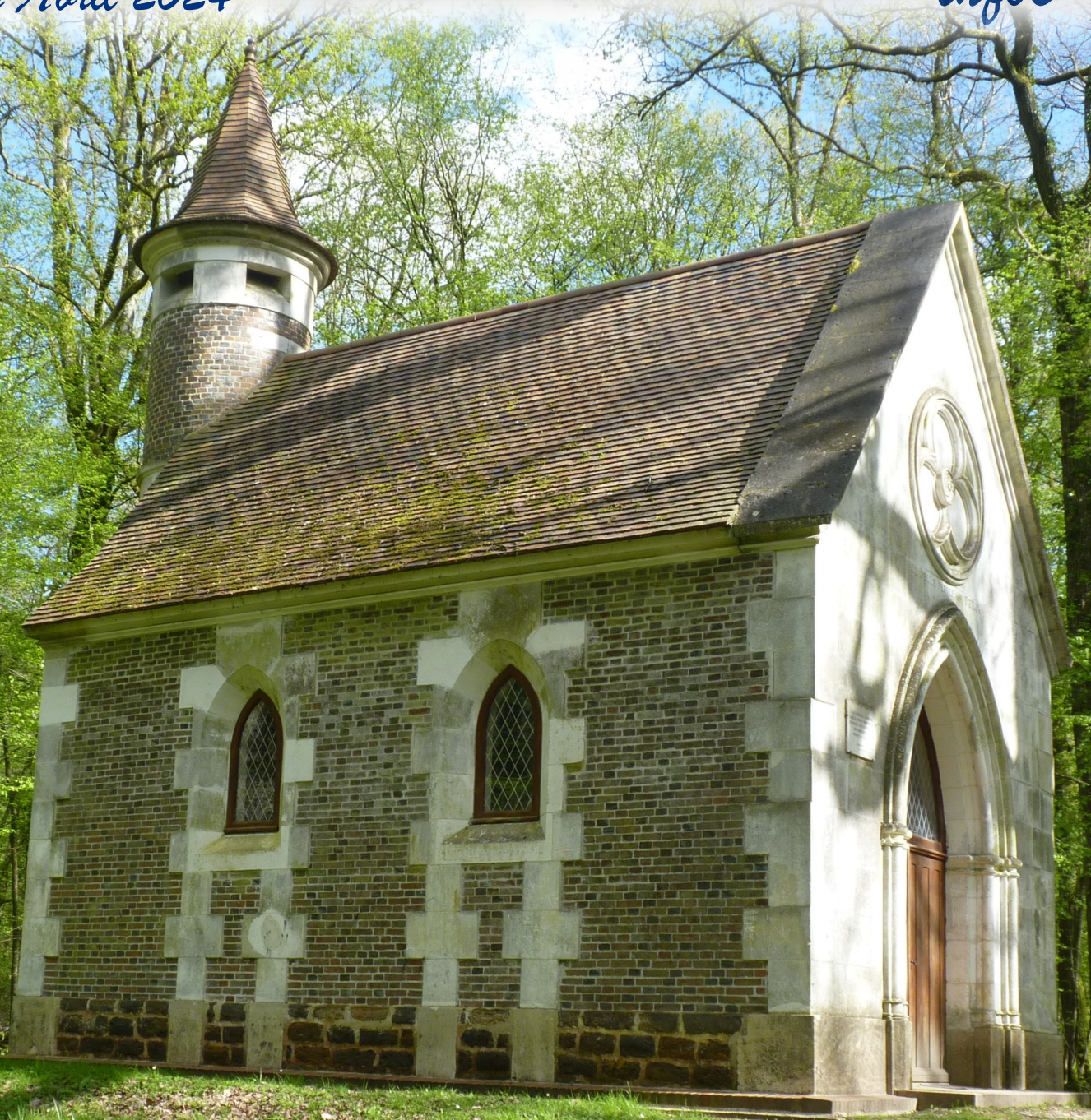
La chapelle Saint-Félix